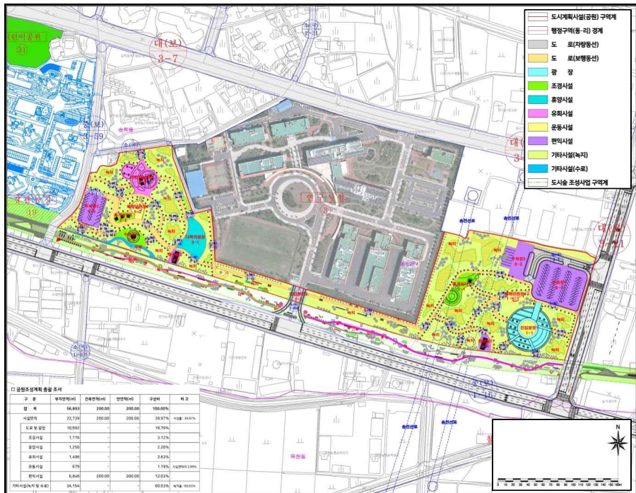
[ 공원조성계획 결정(안도) ]