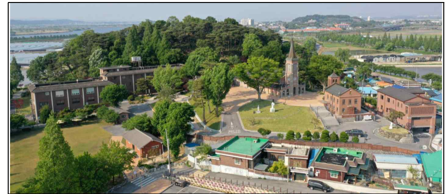
[ 나바위성지 역사공원조성계획(안) 조감도 ]