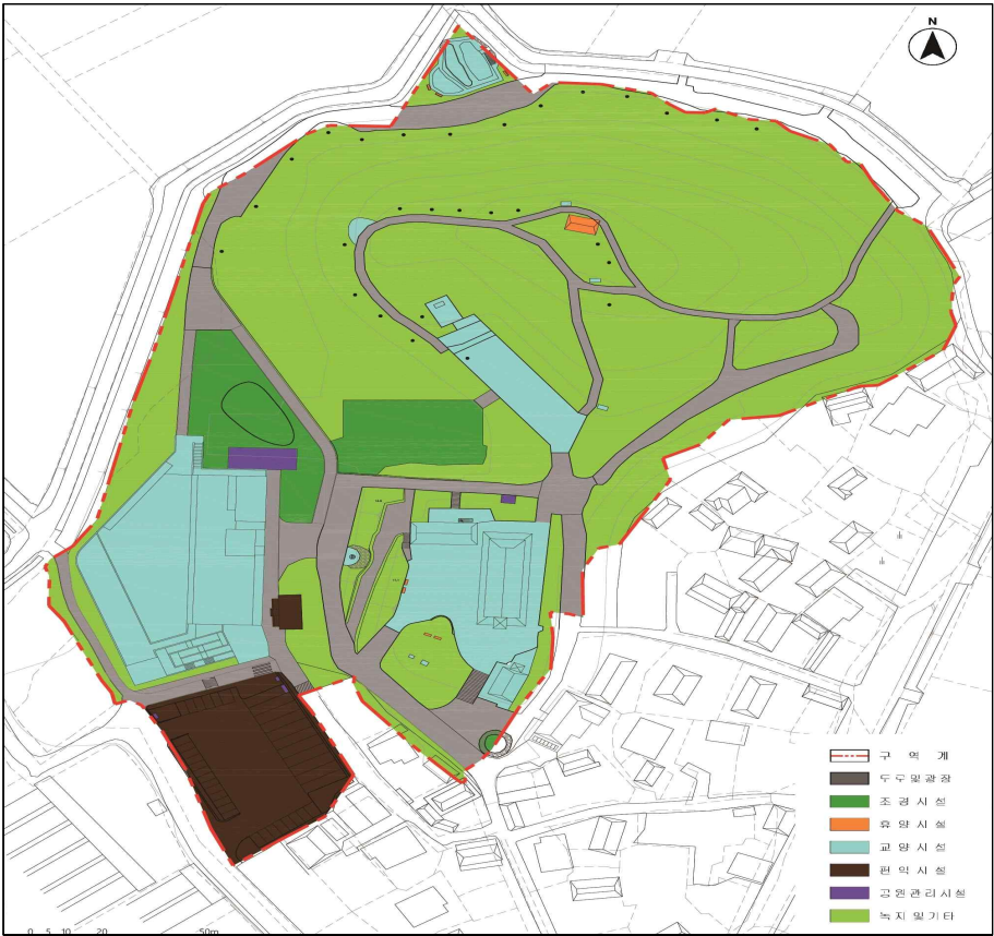
[ 공원조성계획 결정(안)도 ]